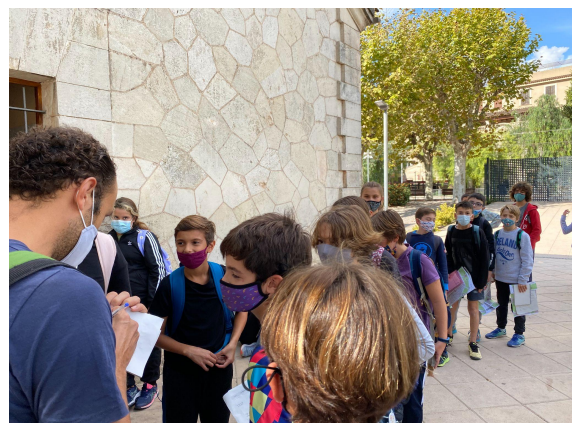
Alumnes durant la sortida